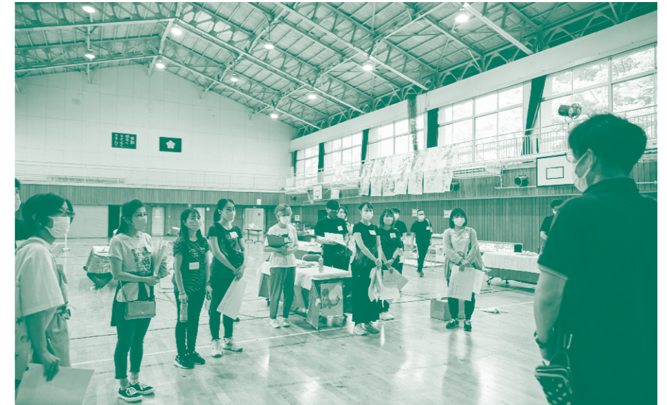
ワークショップ当日の朝、手順を確認するファシリテーター

が必要なのか」という意見もありました。先生は、毎日あられだけの愛情をかけて子どもたちと関わってくださっていますので、そういった意見も分かります。ですが、いざ学校の外へ出る時に、どうやって他の人に自分の子どもの苦